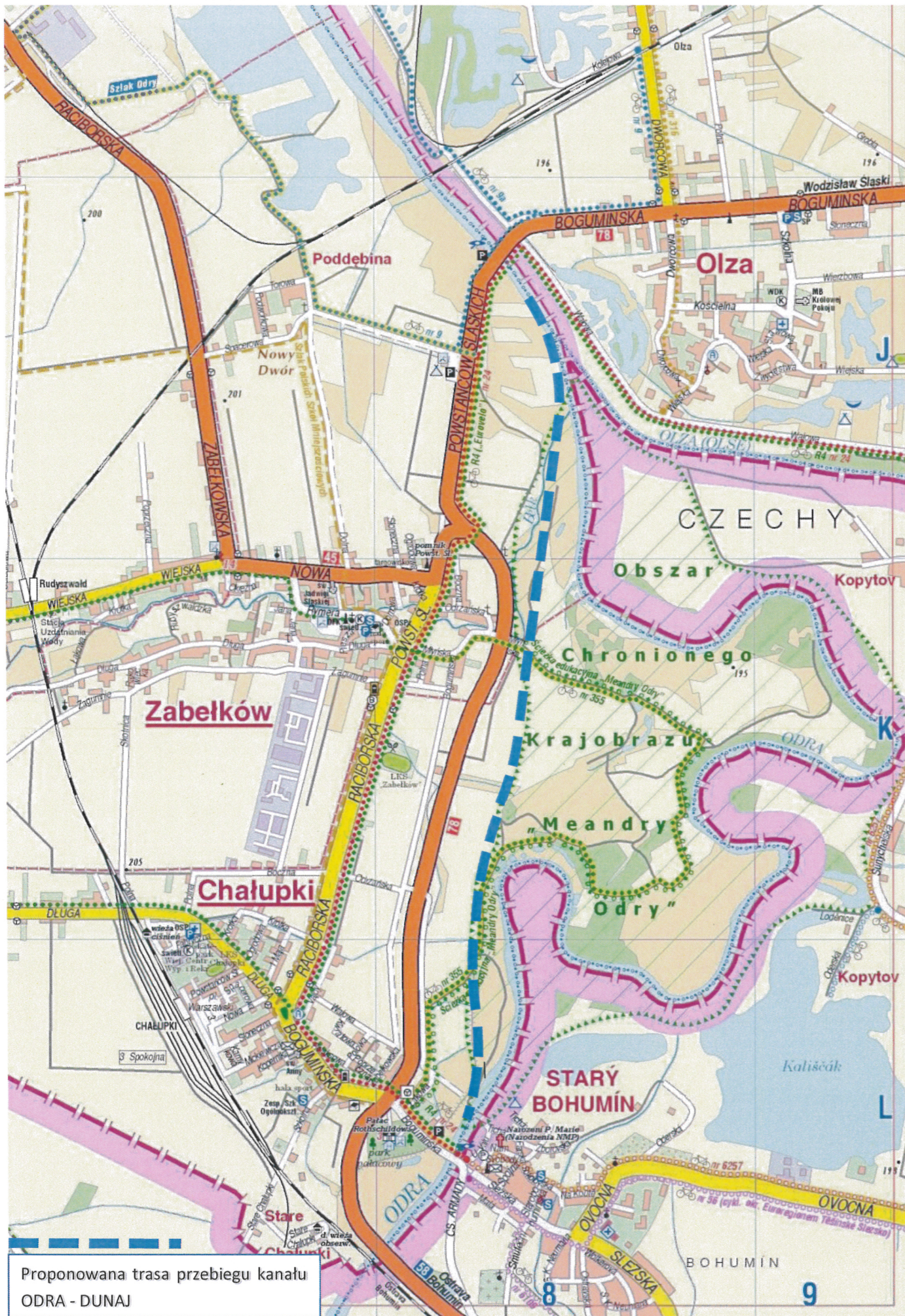
Proponowana trasa przebiegu kanału ODRA - DUNAJ