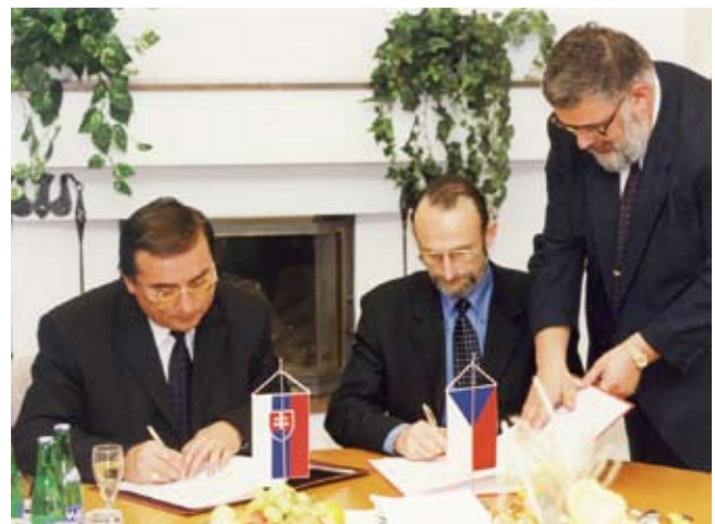
U příležitosti mezinárodních konferencí TRANSPORT byla uzavřena řada významných mezinárodních smluv.

Na Shromáždění členů dne 7. 4. 2009 byla podepsána nová dohoda o spolupráci Sdružení s Moravskoslezským krajem a Krajskou hospodářskou komorou, ze které vyplývá i charakter rámcové koordinace dalších regionálních aktivit a uskupení. K prezentaci své činnosti Sdružení vydává mimo jiné Regionální podnikatelský zpravodaj.