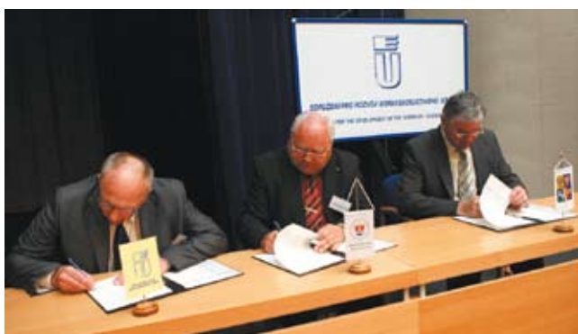
Podpis Dohody o spolupráci uzavřené mezi Moravskoslezským krajem, Krajskou hospodářskou komorou MSK a Sdružením pro rozvoj MSK na Shromáždění členů dne 7. 4. 2009.

Mezi členy Sdružení je mnoho takových, kteří zastupují řadu subjektů dalších. Počet subjektů přímo či nepřímo organizovaných ve Sdružení je tak několik tisíc se zhruba půl milionem zaměstnanců.