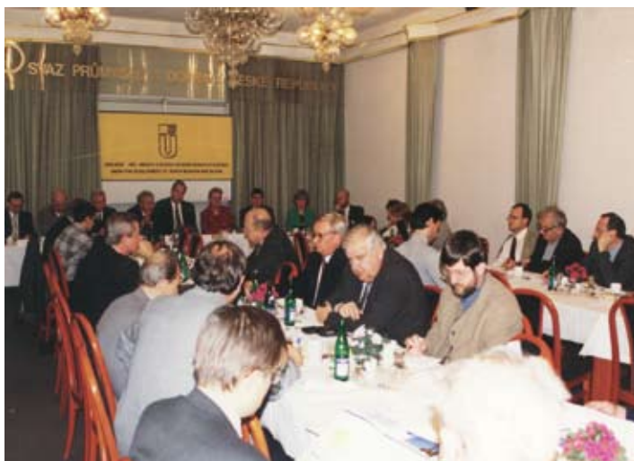
Prezentační dny Sdružení pro obnovu a rozvoj severní Moravy a Slezska v Praze koncem 90. let - tisková konference.

19. 6. 1995 byla Radou Sdružení schválena základní opatření, dlouhodobé regionální cíle a program činnosti Sdružení, které se postupně stalo uznávaným představitelem podnikatelské sféry regionu s širokým, víceoborovým zázemím a nositelem regionálních priorit.