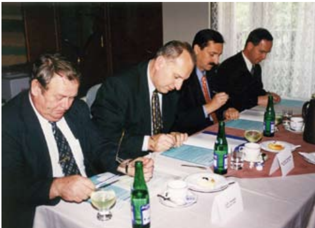
Podpis Memoranda o spolupráci při řešení dopravní obslužnosti a rozvoje železniční infrastruktury v Moravskoslezském kraji v roce 2001.

Dohodnuta byla i spolupráce s tehdejší Úřadem zmocněnce vlády pro revitalizaci Moravskoslezského kraje a s dalšími partnery včetně zahraničních.