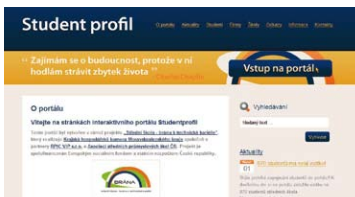
Úvodní stránka portálu www.studentprofil.cz