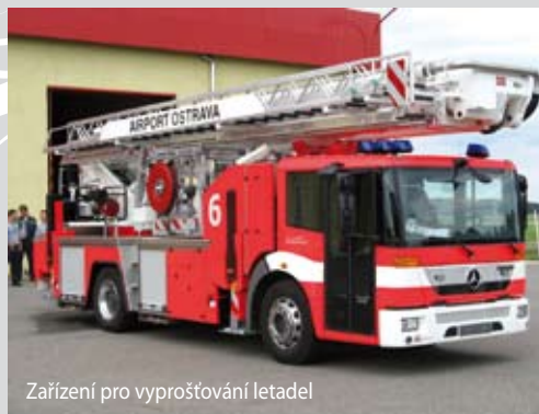
Zařízení pro vyprošťování letadel

Mezi nejnákladnější položky tohoto projektu patří nákup zařízení pro vyprošťování letadel, vozidlo na likvidaci chemických havárií a hasič letištní speciál, což je zásahový automobil pro likvidaci leteckých havárií, jehož pořizovací cena činí téměř 26 milionů korun. Žádná z investic v rámci tohoto projektu nepřináší přímé finanční výnosy, jejich provedení je však nutným předpokladem pro další rozvoj letiště a zvýšení jeho konkurenceschopnosti. Předpokládaná celková suma investic do roku 2013, kterou by chtělo letiště ve spolupráci s Moravskoslezským krajem čerpat z evropských fondů, je přibližně 2,5 miliardy korun.