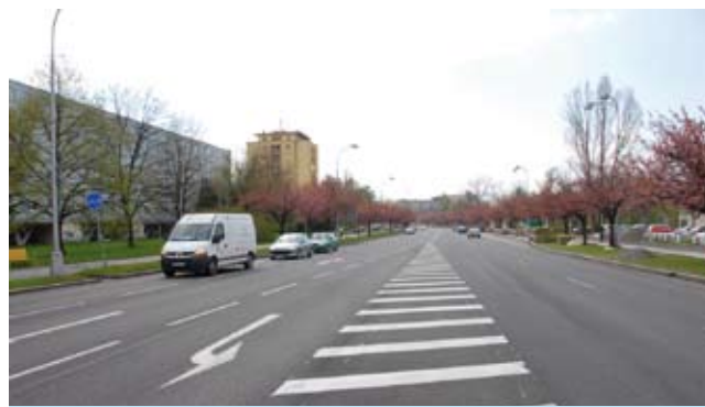
Třída 17. listopadu je jedinou pořádnou silnicí ve směru od Ostravy přes Karvinou na Český Těšín. Bohužel vede centrem města a denně jí projedou tisíce aut včetně nákladních. Karviná potřebuje obchvat, neboť tranzitní doprava výrazně zhoršuje kvalitu ovzduší přímo ve městě.

Podpora místního podnikání je podle něho to, co samospráva dělat může, ale jen v omezené míře. „Nemůžeme ale například stavět nové silnice nebo sami vyčistit vzduch ve městě. Nemůžeme stavět pro lidi nové byty a nemůžeme přímo vytvářet pracovní místa. To jsou úkoly pro stát a podnikatelský sektor, reprezentovaný podnikatelskou komorou nebo svým způsobem mnohé aktivity zastřešujícím Sdružením pro rozvoj Moravskoslezského kraje. Tlačíme na stát, aby se konečně začal stavět silniční obchvat Karviné a spojky na páteřní silnice, protože bez dobré silniční infrastruktury k nám noví investoři nebudou chtít. A bez obchvatu se nám centrum města bude stále dusit výfukovými plyny z tisíců aut denně - jinou možnost, jak se dostat na Ostravu nebo na druhou stranu směrem na Těšín, totiž nemají, a tím pádem nám doprava přidává exhaláty do už tak nedobrého vzduchu, který tu dýcháme,“ říká Tomáš Hanzel s tím, že doufá, že bude Karviná úspěšná v tlaku na stát, pokud jde o řešení zásadních otázek kvality ovzduší v regionu. „Bez ohledu na stranickou příslušnost doufám, že ministr životního prostředí Drobil je konečně někdo, kdo z našeho kraje pochází a ví, jak nám v tomto ohledu konečně pořádně pomoci,“ uzavřel primátor Karviné Tomáš Hanzel.