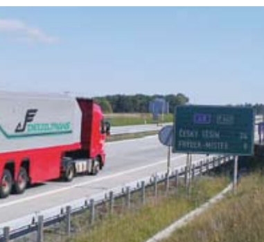
Konference Transport – čtěte na stranách 8 a 9