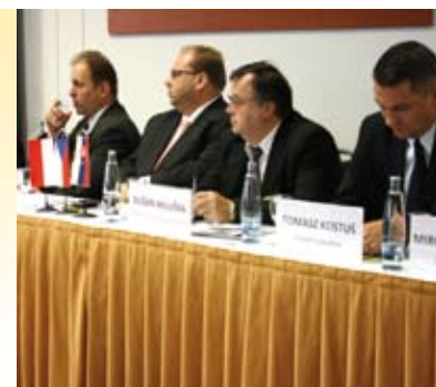
Česko-polsko-slovenské ekonomické fórum 2013 – str. 13