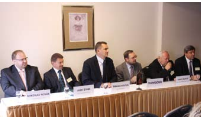
Představitelé Moravskoslezského kraje, Žilinského samosprávného kraje a Opolského vojvodství jednali společně se zástupci komory.

Zástupci Moravskoslezského kraje, Žilinského samosprávného kraje, Opolského vojvodství a Slezského vojvodství svorně považují za nejpodstatnější krok v rozvoji příhraniční spolupráce společný podpis úmluvy a stanov Evropského seskupení pro územní spolupráci TRITIA