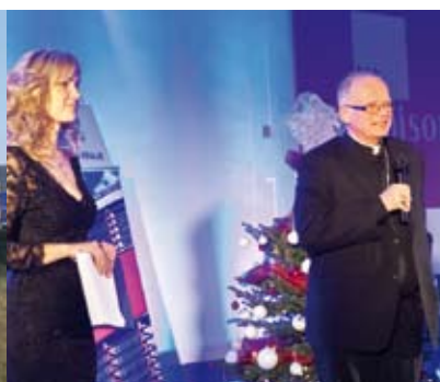
Region pro sebe – více na straně 10