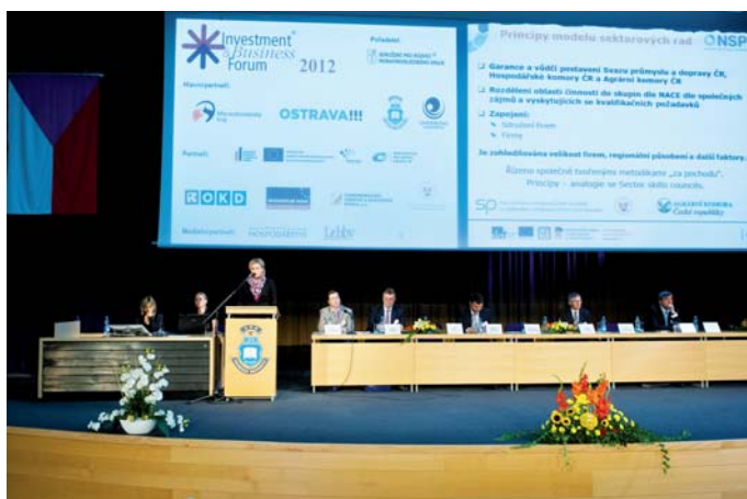
Účastníci 2. panelu