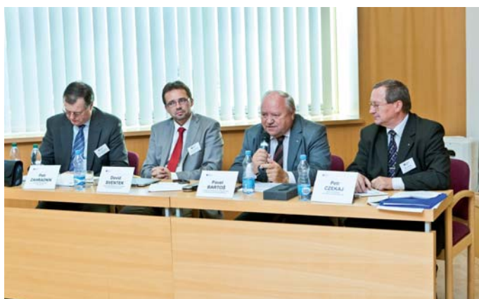
Účastníci 1. kulatého stolu

Konference IFO 2012 představovala pro realizátory Moravskoslezského paktu příležitost ověřit si, zda jsou strategické priority Moravskoslezského paktu zaměstnanosti nastaveny správně, zda klíčové projekty Paktu v Integrovaném programu rozvoje