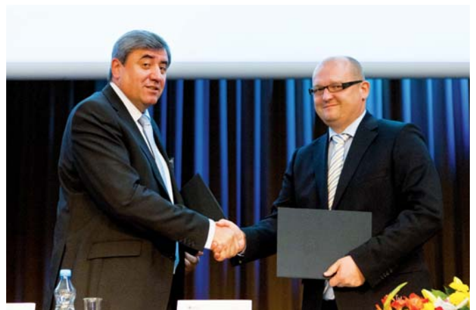
Podpis Memoranda o spolupráci mezi ČEB a KHKMSK