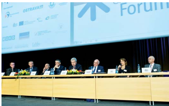
Účastníci 2. kulatého stolu