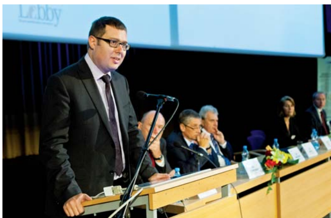
J. Nantl - 1. náměstek MŠMT

Jedním z aktuálních znaků rozvoje společnosti třetího tisíciletí je využívání interdisciplinárního přístupu a propojování výsledků výzkumu a vývoje oborů na první pohled výrazně vzdálených. Vznikají nové oblasti konvergence, které se velice dynamicky rozvíjejí a propojují technické a inženýrské vědy s přírodními věda-