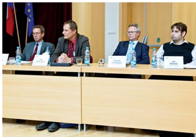
Účastníci 1. kulatého stolu