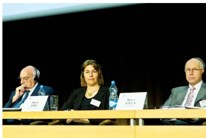
Představitelé univerzit z Francie, Dánska a Finska

Třetí panel Konkurenceschopnost a vzdělávání měl hlavní téma zaměřeno na připravovanou možnou integraci dvou univerzit v Moravskoslezském kraji – Vysoké školy báňské - Technické univerzity Ostrava a Ostravské univerzity v Ostravě.