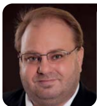
Miroslav Novák, hejtmán Moravskoslezského kraje

Sdružení pro rozvoj Moravskoslezského kraje je naším důležitým partnerem, se kterým již dlouho spolupracujeme. Během své pětadvacetileté existence uskupení, které sdružuje členy různých zájmů, dokázalo, že umí koordinovat a prosazovat projekty a cíle, které jsou v zájmu celého regionu. Sdružení přispívá ke správnému pojmenování problémů, se kterými se náš kraj potýká, a urychluje nalézání vhodných řešení.